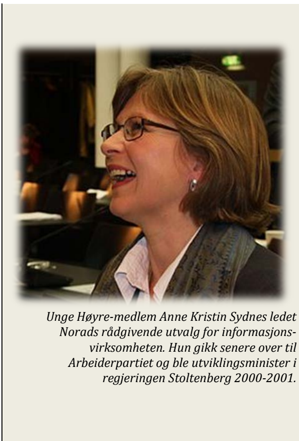
Unge Høyre-medlem Anne Kristin Sydnes ledet Norads rådgivende utvalg for informasjonsvirksomheten. Hun gikk senere over til Arbeiderpartiet og ble utviklingsminister i regjeringen Stoltenberg 2000-2001.

- Alle de politiske partiene var med. Jeg hadde et rådgivende utvalg for informasjonsvirksomheten som var ledet av Unge Høyre-medlemmet Anne Kristin Sydnes. Hun var en veldig god støtte å ha. Det kom omkring 1985 til et par politiske skjæringer med den politiske ledelsen under utenriksminister Sven Stray i Utenriksdepartementet. Én episode var knyttet til den første utgivelsen av rapporten om Menneskerettighetene i Norges hoved-samarbeidsland i 1985. Bistandsminister Reidun Brusletten hadde gitt meg, som Norads informasjonssjef, instruks om å støtte prosjektet som ble utført av forskere ved CMI i Bergen (blant dem Jan Egeland og Bernt Hagtvet) med 50 000 kr.